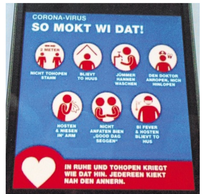
Corona-Hygiene geht ok op Plattdüütsch.

„WhatsApp“ lehrt Plattdüütsch meist bi to. Dat Rechtschrievprogramm behölt ok de plattdüütsche Schriewies un bütt dat weder an bi de nächste Text. Un wenn een partout nich