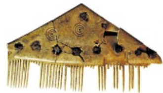
A kum uun't gehial.

Ales wurd enkeltwiis beluket, man at swaar wiar leewen wedder at salew: hirscknook.