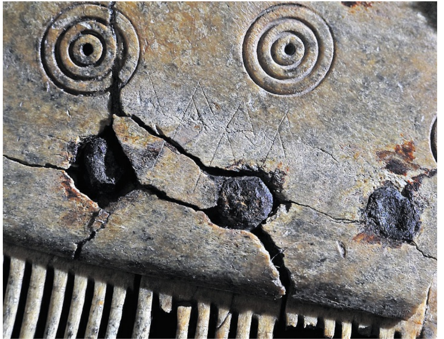
Diar hiart was uk lok tu, am sok fiin ruunen waar tu wurden. De hiale kum as nemelk man bluut 11,5 cm briad.

Jo kaam faan a Uastasia an ferlicht uk faan Norwegen an wiar en bruket skööl faan nuurdlijdj, wat at saien uun detdiar regjuun auernimen hed. Huaram diar nü hoker faan jo üüb a toocht kaam, det wurd „kum“ üüb en kum tu skriiwen, kön ham natüürelk ei muar nau ütjfinj. Man för kultüüren, wat jar spriak bluut snaaket an ei skreew, hed buksteewer miast wat magischs. So küd en wurd feesthelen an uk wedderhaalet