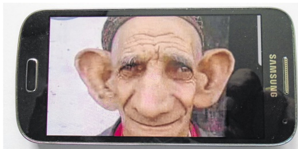
Handy-Impressionen in Corona-Tieden.