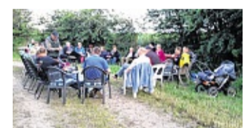
Fier op de Norderwech. OLDSSEN

Sünnobend wer Schüttenfest vun de veer lüttje Dörper Hoxtrup, Kragelund, Eckstock un Boxlund, de siet jeher al emme Feste tosom fiern dot; uk de Beerdigungen. Is dor een sturm, kummt een Person ut jederd Huus vun de veer Dörper mit to Kark un meistens uk noch mit to de Kaffeetafel. Tomindest versöcht man an disse Bruuck fasttoholen, dormit de Angehörigen vun de, de sturm