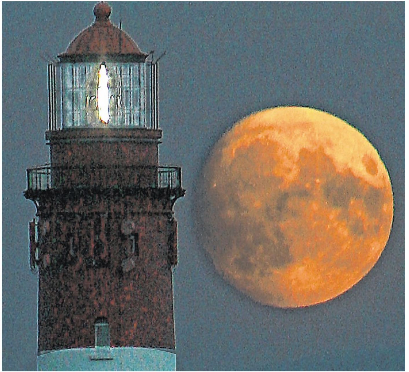
Det spal faan't laacht uun a naacht as uun a naite faan a ialtürn al smok, man wan a muun diar noch tukomt, do woort at wonerboor.