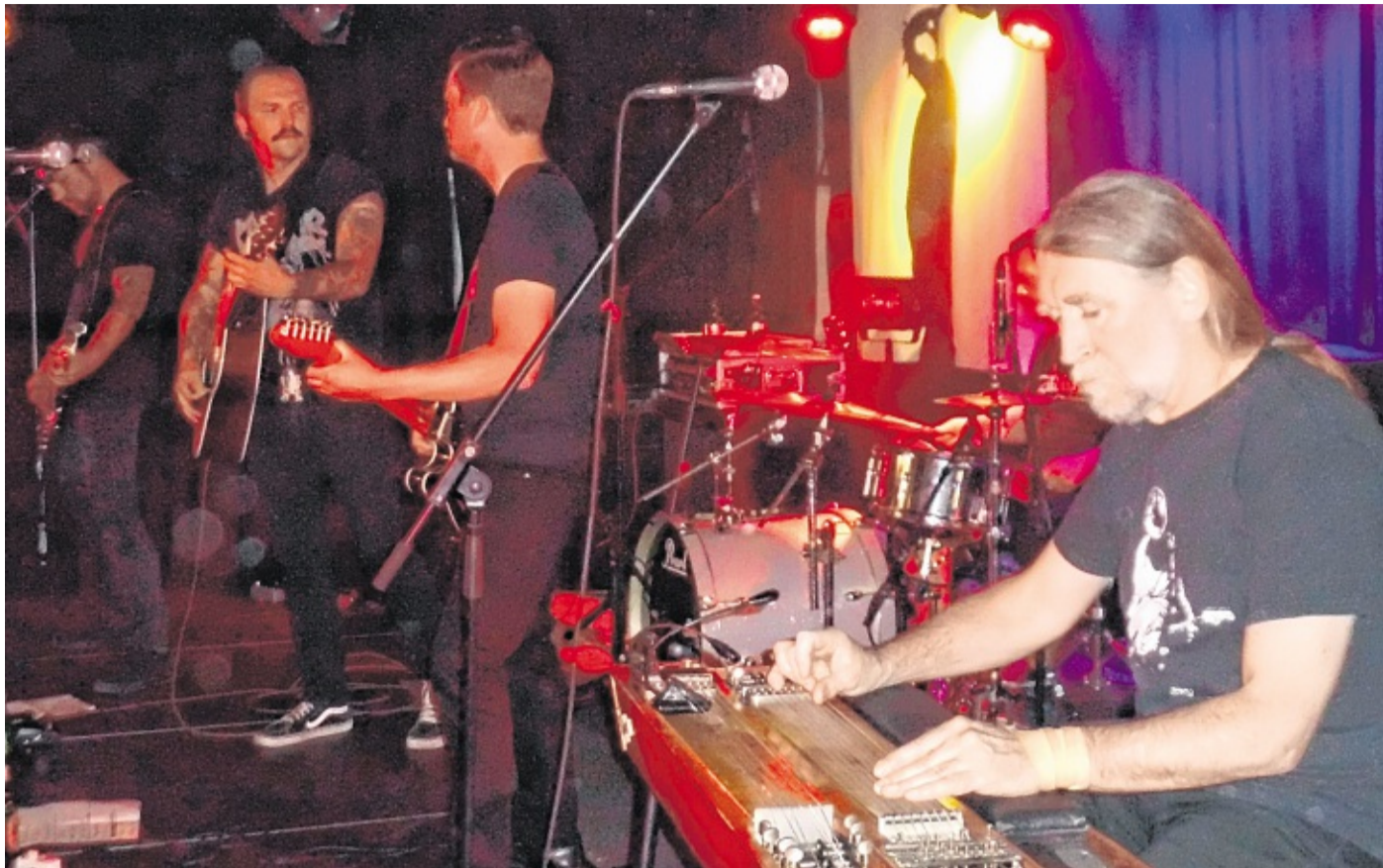
Aalkreih wiest, wat plattdüütsche Musik kann.