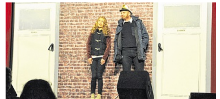
At köösch Ellen an Koptein Rickerts teew üüb Tante Maier.