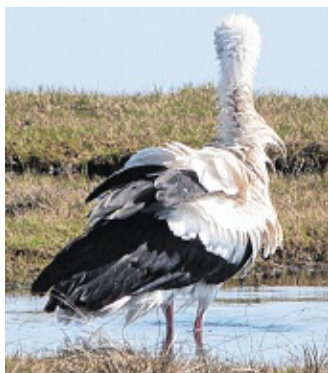
He schüttel sik un nochmol de ganze Prozedur...

Dat weer so üm Klock Twee nameddags. Dree Äbers weern al dor. Dor keem noch een anflagen un stüer richti so'n Waterlock un weer an't Kieken un Tostöten. He funn wat. Avers denn stüer he een Steed an, de en beten deeper weer un düker oop eenmol richti ünner un weer an't spad-